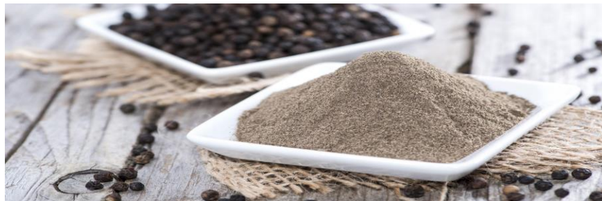
Hochwertigste Gewürze und Gewürzmischungen

Ihr Partner in Deutschland – Österreich – Schweiz auch für